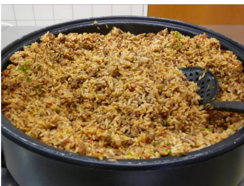
Jollofreis (einfache Art)