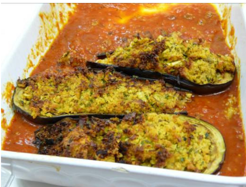
Gefüllte Auberginen „orientalisch“